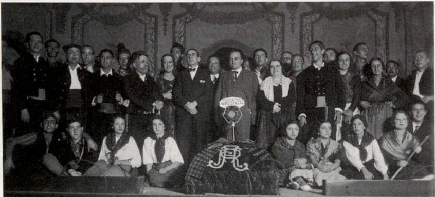
Estrena de l'obra "La cançó del vell Cabrés". Teatre Vidal de Sant Feliu de Guíxols. 7 de novembre de 1932.

ERA UN HOME! , comèdia en 3 actes i 9 quadres. Lletra de Max Deauville i traducció de Ventura Gassol.