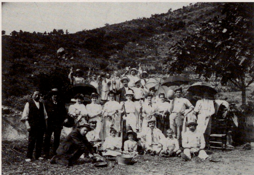
Les famílies Torrent i Romaguera, en una sortida a Can Pey, a principis de segle.

Neix el 1901 a Cuba, al barri de l'Havana anomenat Regla, on la seva família hi té activitats comercials, en concret, un negoci de carbons vegetals. Quan només ha complert els dos anys, els seus pares tornen a Sant Feliu de Guíxols, on havien nascut i a on cursa els estudis elementals. També comença a estudiar comerç i comptabilitat, amb la intenció de tornar a l'illa caribenya i de seguir el negoci familiar. Als disset anys torna cap a Cuba, però es troba amb una situació inesperada: els llocs d'oficina del negoci familiar ja eren ocupats per altres membres de la família. Un xic decebut, decideix tornar cap a Sant Feliu i es decanta per la carrera eclesiàstica. Així, a Sant Feliu mateix, es prepara per entrar al seminari de Girona, on hi estudiarà durant set o vuit anys. Aquí entra en contacte amb una cultura eclesiàstica i humanística alhora (els cursos de filosofia, la teologia...).