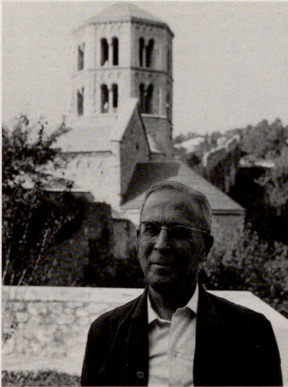
Girona, (1966), amb Sant Pere de Galligants al fons.