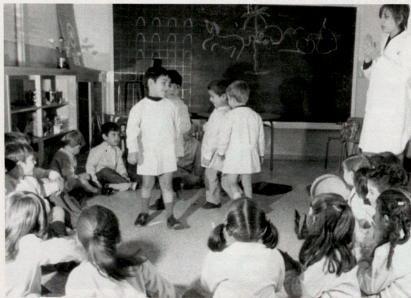
Aula de preescolar, noviembre de 1972.

Se fomentó el cultivo de las bellas artes con clases de música, dibujo y danzas. Se formó el Coro Escolar que nos ha deleitado en muchas ocasiones con el conjunto de sus bien timbradas vocecitas y el Esbart Infantil que nos ofreció sus habilidades en señaladas fiestas escolares. Se ha prestado atención en el campo de la cultura física fieles a la secular divisa de Mens sana in corpore sano .