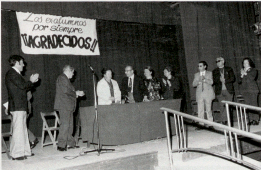
Los homenajeados con el claustro, junto a sus compañeros de claustro.

Pero como hay que sacar partido de lo que uno tiene, según aprendí en mi existencia en estas Escuelas; antes de preparar estas líneas de homenaje a nuestros profesores, por la paciencia que han tenido soportándonos durante 25