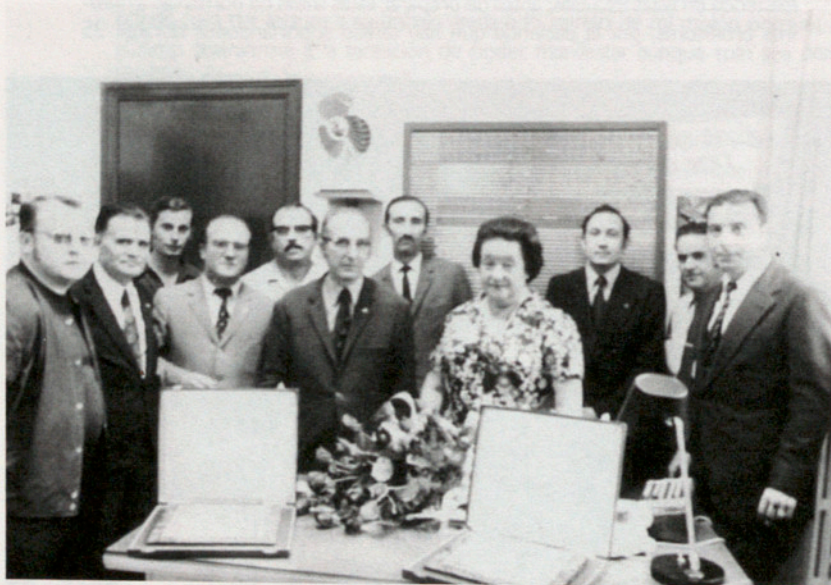
El homenaje fue organizado por los ex alumnos. Participó también la asociación de Padre de Familia.

Yo reconocí las razones de mi amigo e intenté consolarle, pero sin que yo sepa aún como nuestra conversación derivó de tal forma que al cabo de unos minutos, casi era él quien me consolaba a mi por no haber podido nunca cultivar vides tan ubérrimas como las suyas, con compañeros tan trabajadores como los