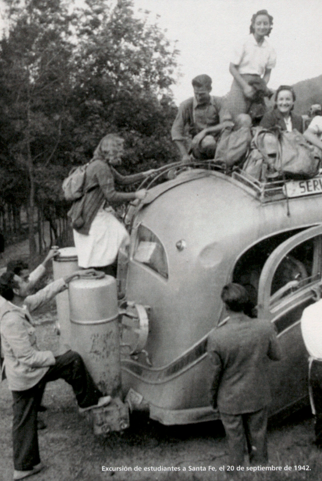
Excursión de estudiantes a Santa Fe, el 20 de septiembre de 1942.