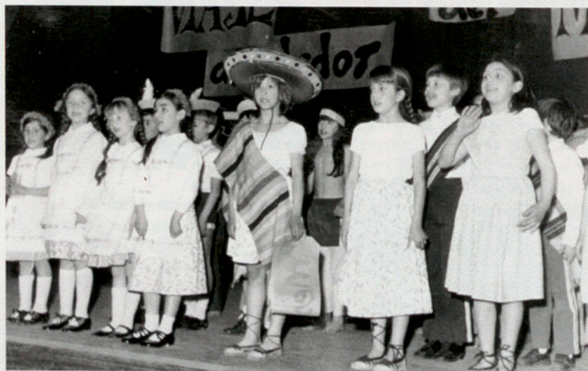
Actuación de los alumnos en la celebración de las Bodas de Plata de las Escuelas, en el año 1973.

Además de impartir el Plan de Enseñanza vigente se completa con clases especiales de Música, Dibujo, Mecanografía, Contabilidad y de cuánto podía contribuir a su completa formación. También se inician clases nocturnas para adultos en las que se