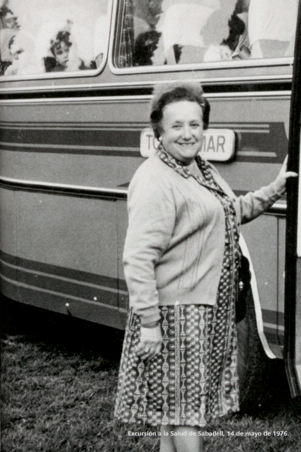
Excursión a la Salud de Sabadell, 14 de mayo de 1976.