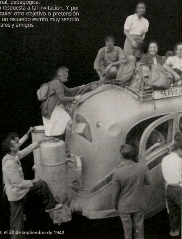
Excursión de estudiantes a Santa Fe, el 20 de septiembre de 1942.

Este librito viene a ser la respuesta a tal invitación. Y por eso mismo rehúsa cualquier otro objetivo o pretensión que no sea éste: ofrecer un recuerdo escrito muy sencillo a sus ex alumnos, familiares y amigos.