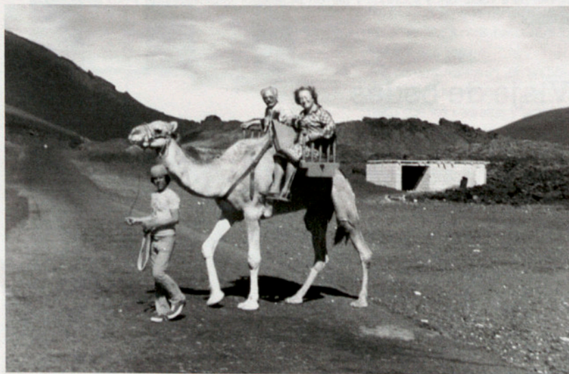
8 de febrero de 1979. Montaña del fuego, Lanzarote.