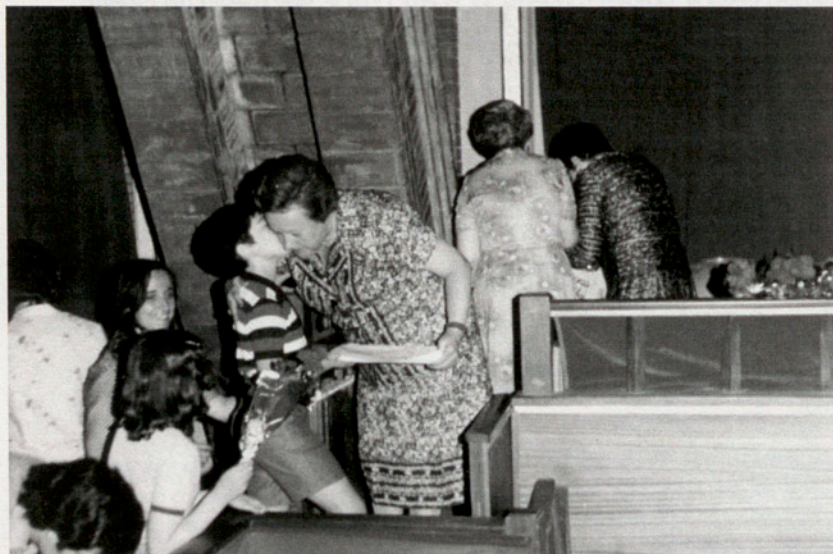
Fiesta escolar. Ofrenda del segundo curso por los alumnos, con motivo de mi jubilación, 1978.

Es, pues, sincero el gozo al ver que nuestros deseos se verán cumplidos en un futuro próximo, logrando que la incorporación a los diversos cursos puedan realizarla todos los alumnos sin grandes esfuerzos, con un avance progresivo y en la adquisición y utilización funcional de hábitos y de técnicas instrumentales que a la par vayan formándoles la capacidad para la convivencia, con la comunidad a la que pertenecen, haciéndoles sentir que no existen fronteras culturales sino que en el terreno del espíritu, nacional e internacionalmente hablando, el mejor nexo es el amor.