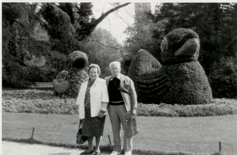
Isla de Mainau o de las flores. Lago Constanza, 15 de octubre de 1991.