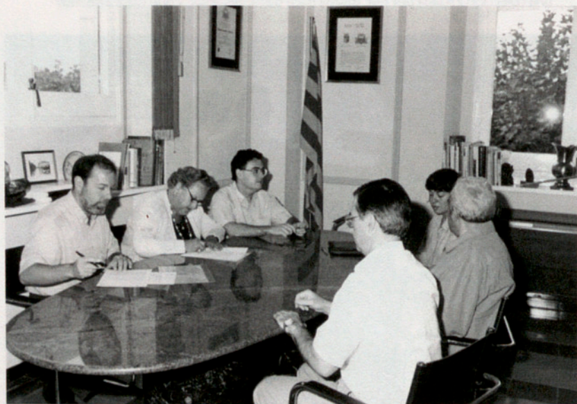
El día 21 de septiembre de 1994 se trasladó el fondo bibliográfico de María Xifró a una sala del edificio del monasterio, anexa al Archivo Municipal.