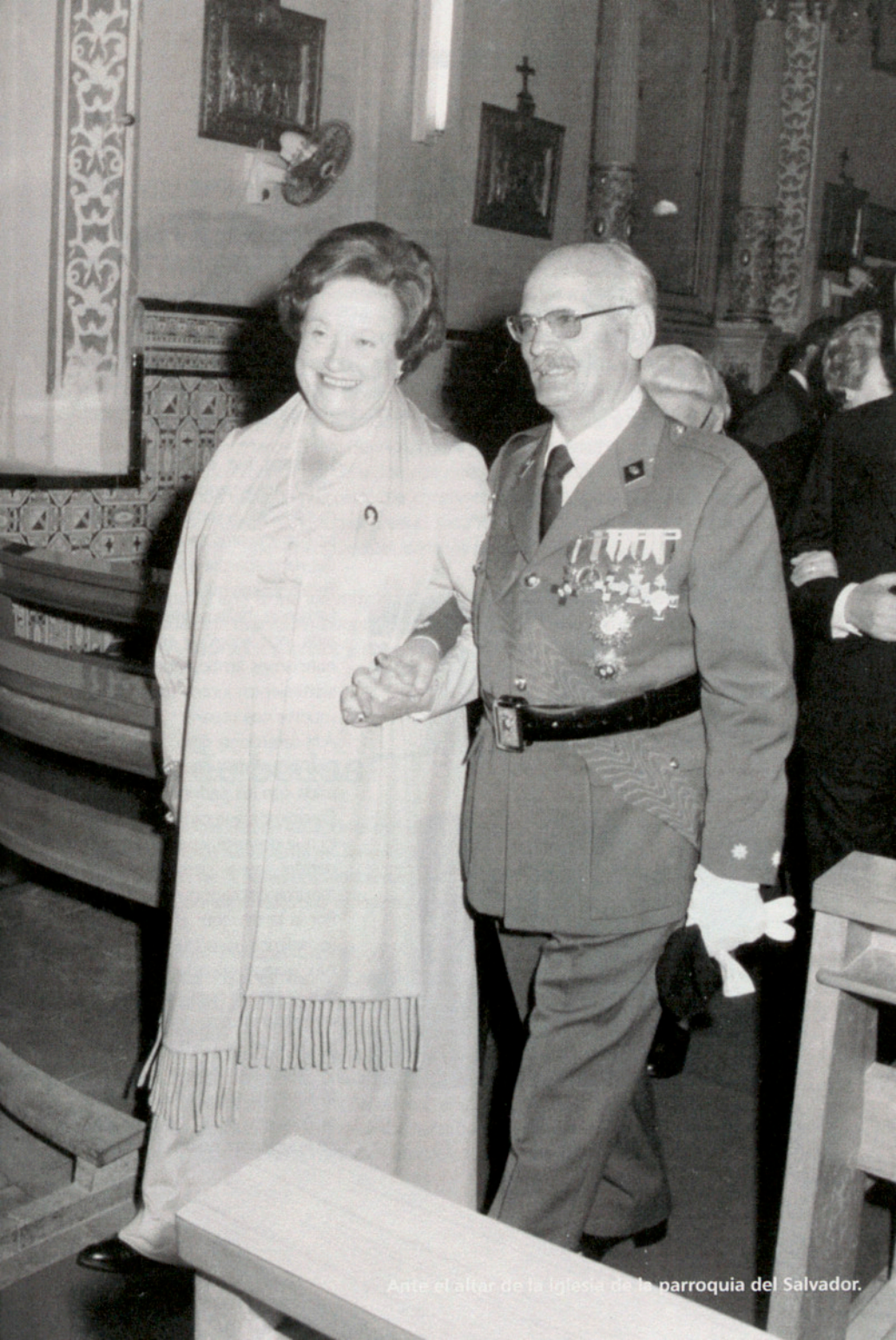
Ante el altar de la Iglesia de la parroquia del Salvador.