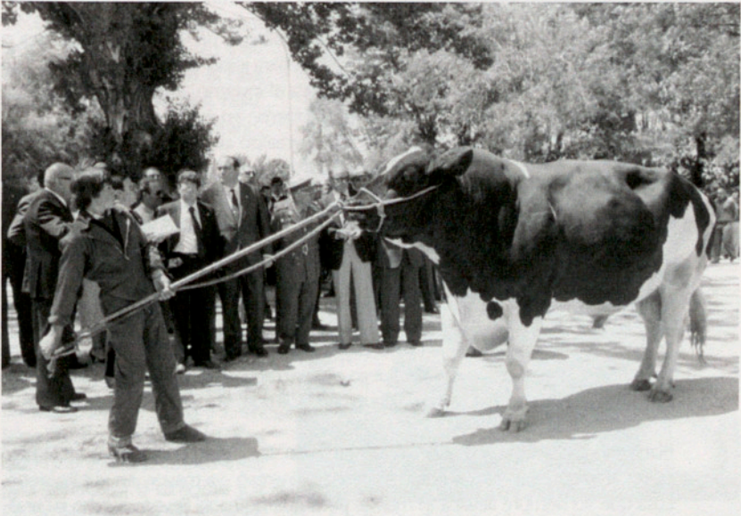
Burgos, 1980. Concurso de ganado en las fiestas de San Pedro.

Algunas tardes merendábamos en pleno campo, con bellísimos atardeceres.